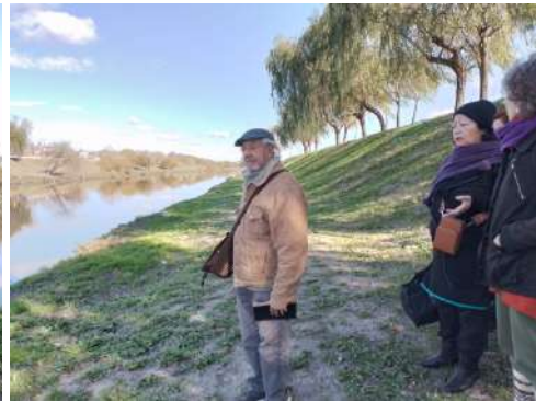
Caminata, actividades y almuerzo a la vera del Río Chuelo Rectificado