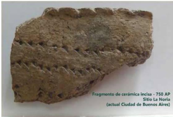
Fragmento de cerámica incisa - 750 AP Sitio La Noria (actual Ciudad de Buenos Aires)

Jornada que invita a la reflexión histórica y a la visibilización de la resistencia indígena, en reivindicación del derecho a la cultura y al territorio