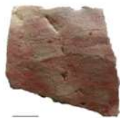
Escudilla - pigmento rojo