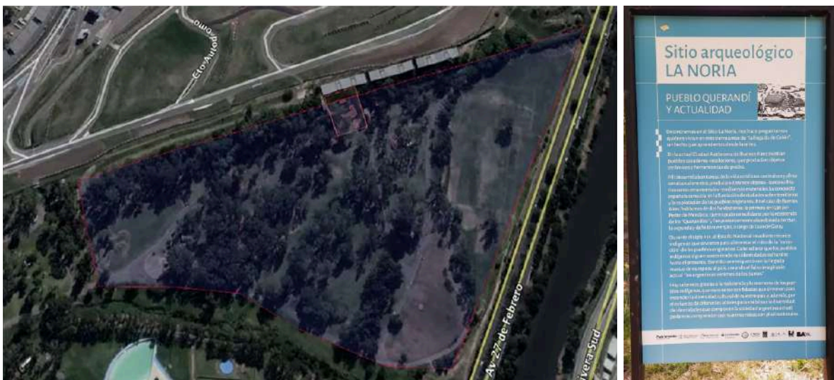
Foto Satelital del Sitio Arqueológico La Noria -Nota Infobae 8 de agosto 2018 18

En la Cuenca del Río Matanza/Riachuelo, en las cercanías del Puente La Noria, a partir de los años veinte, se realizaron excavaciones, en el barrio de Lugano (Villa Riachuelo). Carlos Rusconi en 1928 halló una enorme cantidad de objetos querandíes, en particular cerámica. Los lugares señalados por él, se encuentran en una vasta zona lindera al Río Chuelo (verdadero nombre en lengua querandí het) y en las tierras donde hoy se emplaza el Autódromo “Oscar y Juan Galvez” 19 , lindero con el Parque Rivera Sur. En este último, hace pocos años el arqueólogo Ulises Caminos retoma el proyecto y da con algunos restos en los lugares señalados por Rusconi en toda la zona (incluyendo el Autódromo) y descubre los restos de un asentamiento del Pueblo Nación Querandí, en donde se encuentra en la actualidad el Sitio Arqueológico La Noria.