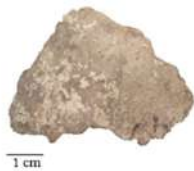
Alfarería tubular - Pigmento blanco