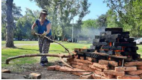
Actividad en el Sitio Arqueológico y de Memoria Querandí Parque Rivera Sur. Horneada de piezas.