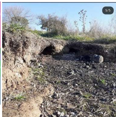
Horno de barranco