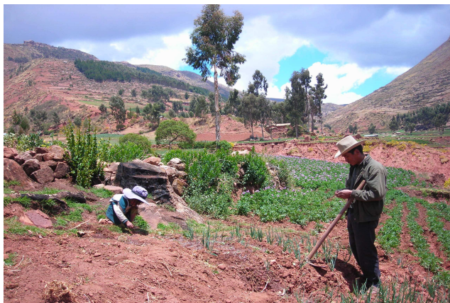
Foto 2 Padre de familia en la parcela con su hijo

Un espacio utilizado por los padres de familia para enseñar a sus hijos son las parcelas o chacras, es un momento de comunicación donde a través del silencio se comunica. Donde también se da un proceso de enseñanza aprendizaje, el niño aprende haciendo y viendo, no es raro que un niño de 12 años este realizando actividades agrícolas solo o acompañado de su hermano menor.