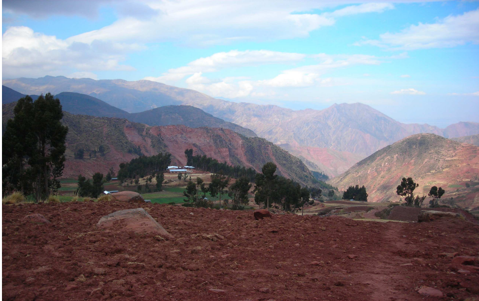
Foto 01 Vista general de la comunidad de Lapiani

El trabajo de estudio de recepción fue elaborado en la comunidad “Lapiani” que pertenece a la sub Central campesina de UchuUchu, municipio de SipeSipe de la Provincia Quillacollo del departamento Cochabamba.