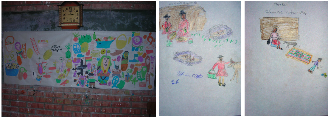
Foto 3 Pinturas realizadas por los niños y niñas de 4° y 5° curso

En las fotos anteriores se demuestran características de la personalidad de los niños y niñas que si bien son datos importantes, la pertinencia no es comunicacional, más bien debería ser la ciencia de la psicología o la psicopedagogía la encargada de realizar un análisis mucho más fino, pero sin embargo, se pueden realizar y destacar elementos visibles en cada uno de los dibujos realizados en alumnos de cuarto y quinto de primaria. Por ejemplo, destacar que en muchas de ellas esta presenta la influencia católica, por el uso de las cruces en todos los cuadros, además es destacable que muchos de los niños conocen u observaron los elementos de una mesa de Todos Santos, por tanto esto va generando concepciones previas que permitirán una mejor y positiva resignificación de los mensajes.