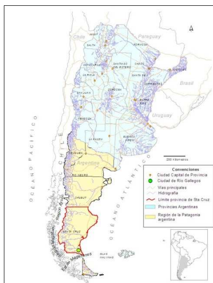
Figura No. 1 Región de la Patagonia argentina y provincia de Santa Cruz