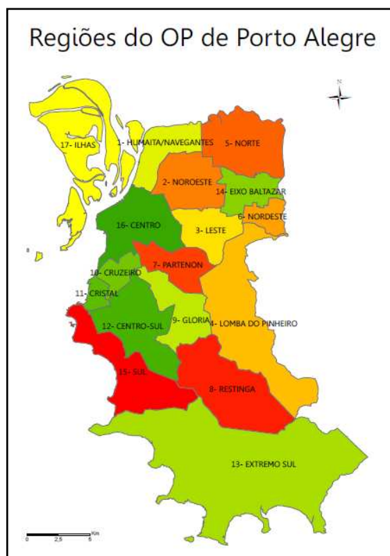
Figura 01 Regiões do OP de Porto Alegre