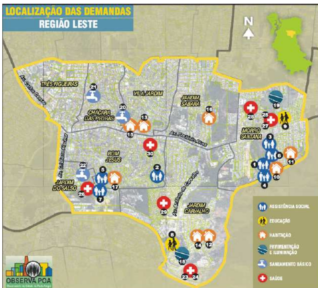
Figura 04 Demandas da Região Leste apontadas em 2011 no OP Porto Alegre