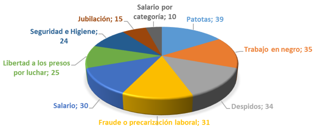
GRÁFICO Nº03: ACCIONES REALIZADAS SEGÚN TIPO DE RECLAMO. ARGENTINA . SEPTIEMBRE 2009-MAYO 2015

En cuanto a las consignas (gráfico 3), el principal reclamo del sindicato gira en torno a los ataques de las patotas de la UOCRA, lo cual se manifiesta en 39 (36,4%) ocasiones sobre el total de las 107 acciones. Le siguen en orden la lucha contra el trabajo en negro (32,7%), los despidos, (31,7%) y la precarización laboral (28,9%), por incremento salarial (28%), en reclamo de libertad a los activistas presos por luchar (23%), en reclamo de mejores condiciones de seguridad e higiene en las obras (22,4%), por mejoras en la jubilación (14%) y por acomodar los salarios según la categoría (9%).