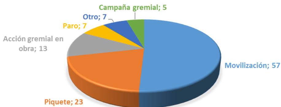
GRÁFICO Nº02: ACCIONES REALIZADAS SEGÚN FORMA DE MANIFESTACIÓN. ARGENTINA. SEPTIEMBRE 2009 - MAYO 2015

En cuanto a las consignas (gráfico 3), el principal reclamo del sindicato gira en torno a los ataques de las patotas de la UOCRA, lo cual se manifiesta en 39 (36,4%) ocasiones sobre el total de las 107 acciones. Le siguen en orden la lucha contra el trabajo en negro (32,7%), los despidos, (31,7%) y la precarización laboral (28,9%), por incremento salarial (28%), en reclamo de libertad a los activistas presos por luchar (23%), en reclamo de mejores condiciones de seguridad e higiene en las obras (22,4%), por mejoras en la jubilación (14%) y por acomodar los salarios según la categoría (9%).