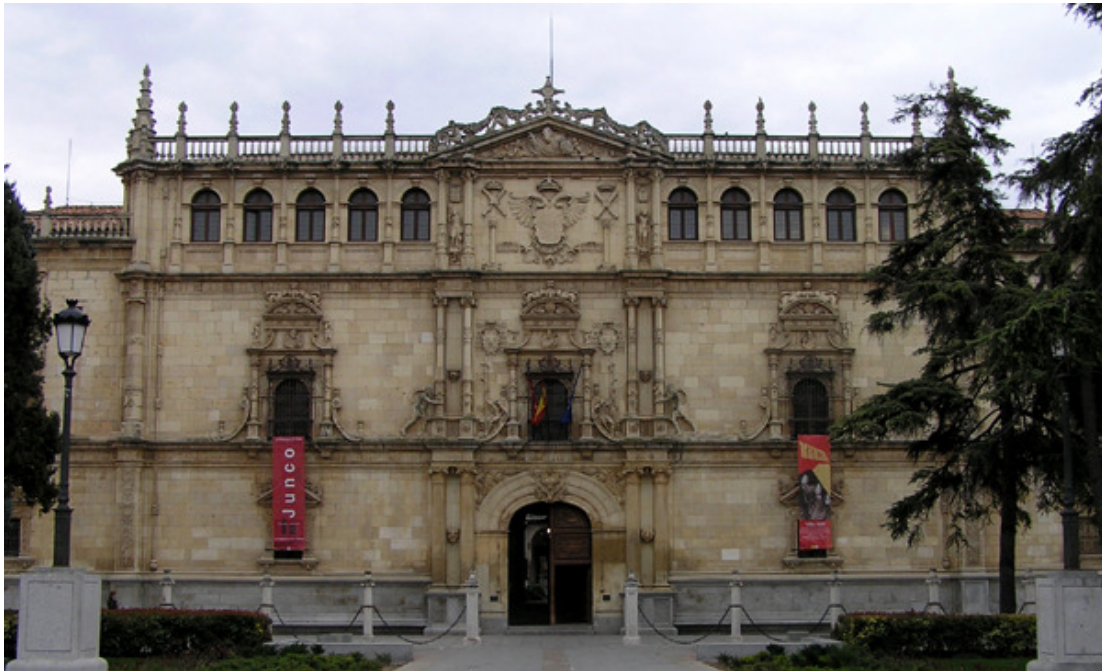
Imagen 2: Fachada del Rectorado de la Universidad de Alcalá de Henares, Colegio Mayor de San Idelfonso (por Rodrigo Gil de Hontañón, 1543) en la que se inspiró la solución iconográfica del Teatro Nacional Cervantes.