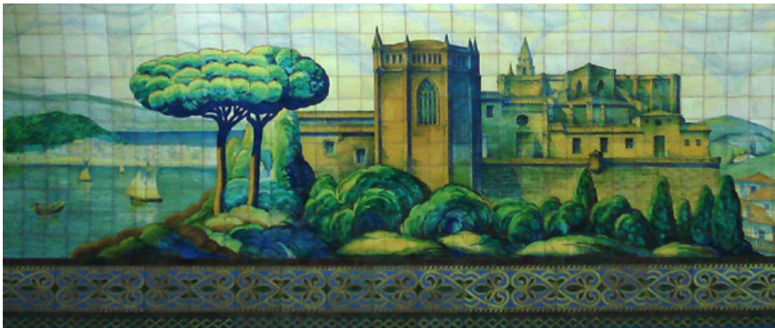
Imagen 5: Detalle del mural de la línea C del subterráneo de la serie “Paisajes de España”, de Martín S. Noel y Manuel Escasany (1934), representando escenas de Bilbao, Santander, San Sebastián, Alava y Navarra, ubicado en la Estación Mariano Moreno, andén a Constitución.

Imagen 4: Mural de la línea C del subterráneo de la serie “Paisajes de España”, de Martín S. Noel y Manuel Escasany (1934), representando escenas de Santiago, Lugo, Asturias y Santander, ubicado en la Estación Mariano Moreno, andén a Retiro.