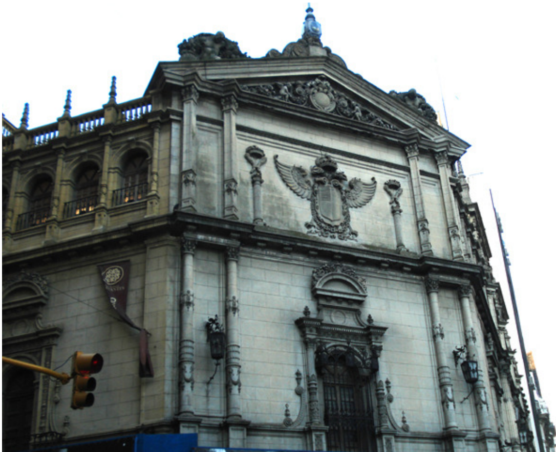
Imagen 1: Fachada del Teatro Nacional Cervantes de Aranda y Repetto (1921).