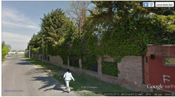
french (paredón x 200 mts) . (Imagen 05)