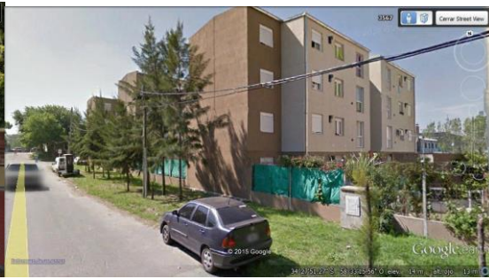
Vista Frente al lateral sobre French plan de viviendas año 2011 (Imagen 06)