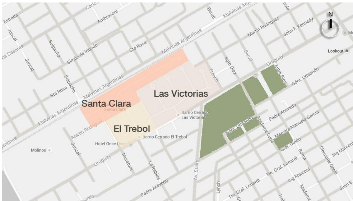
Localización de algunos de los barrios cerrados en Victoria, sobre imagen satelital de google earth (Imagen 02)

Las tres urbanizaciones se hallan contiguas, las Victorias y el Trébol exponen muros que se extienden por 600 metros sobre la Av. Uruguay, en tanto que Santa Clara cierra la calle por el lateral oeste luego de 200 metros sobre Patricios Argentinos. French es el límite oriental.