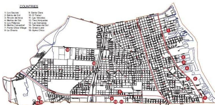
(Imagen 01) Plano ubicación UC dentro del Partido de SF

En la localidad de Victoria registramos la presencia de diez urbanizaciones cerradas (SCA, 2004; GIHU, 2014 Julio 19 y UMEC SF, 2014) la suma de ellas ocupa una superficie de 48 hectáreas aproximadamente. Los más grandes son el Barrio “Las Victorias” ubicado en zona cercana a las fábricas sobre Uruguay, “La Chacra” cercano a la Estación Victoria del Ferrocarril Mitre y la “Marina del Sol” en la zona costera. Y los más pequeños también se ubican en esas zonas siendo Santa Clara, Los Plátanos y Punta Chica Village.