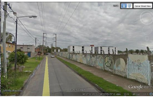
(Imagen 11) Muro perimetral cementerio

Lindero al cementerio se encuentra el asentamiento Santa Rosa, los jóvenes utilizan el paredón como un espacio de encuentro para charlar ya que tiene vereda y la circulación vehicular en esas cuadras casi no existe. Su muro (imagen 11) ha sido intervenido con murales a la altura del barrio. Una de las habitantes del barrio incorporaba el significado del cementerio en la simbología de su discurso separando quienes dentro del barrio tiraban hacia allá y señalando el paredón del cementerio y quienes tiraban hacia acá, simbolizando la vida.