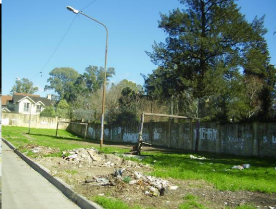
(Imagen 13) MURO CASA RET. ESPIR.

El asentamiento también tiene como uno de sus límites el paredón de La Chacra (imagen 12) y el de la casa de retiros espirituales Monseñor Aguirre (imagen 13)