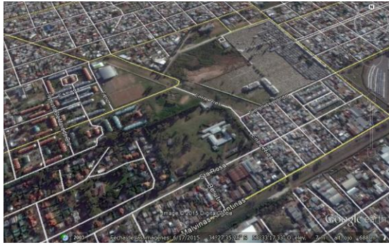
(Imagen 10) Imagen cementerio