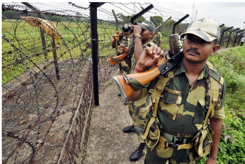
(Imagen 18)

ambos países. Su construcción ha ocasionado que cientos de personas abandonen sus hogares por estar en la línea fronteriza.