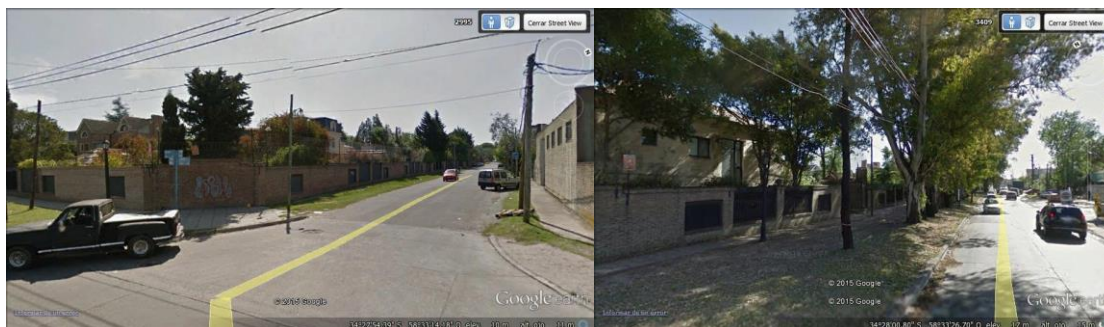
esquina French y Uruguay (Imagen 03)

“(...) Hay mucho contraste, porque desde Uruguay cuando llegan al final, casi a la ruta de vuelta, ahí hay unos colegios que son muy caros en San Isidro y también hay barrios cerrados en San Fernando, entonces juega este contraste. Lo que quiere hacer la municipalidad es terminar de erradicar, con planes de vivienda. Se está trabajando muchísimo a nivel de cloacas. Este año se han entregado muchas viviendas (...) Lo que pasa es que Uruguay...hay un convenio con la Municipalidad de San Isidro donde las cámaras trabajan en forma conjunta cualquier cosa que pasara...este...” (GIHU, 2011 Septiembre 29)