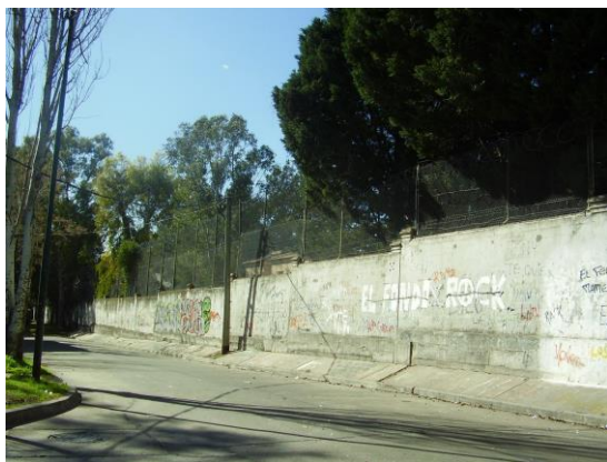
(Imagen 12) Muro UC LA CHACRA 1

Lindero al cementerio se encuentra el asentamiento Santa Rosa, los jóvenes utilizan el paredón como un espacio de encuentro para charlar ya que tiene vereda y la circulación vehicular en esas cuadras casi no existe. Su muro (imagen 11) ha sido intervenido con murales a la altura del barrio. Una de las habitantes del barrio incorporaba el significado del cementerio en la simbología de su discurso separando quienes dentro del barrio tiraban hacia allá y señalando el paredón del cementerio y quienes tiraban hacia acá, simbolizando la vida.