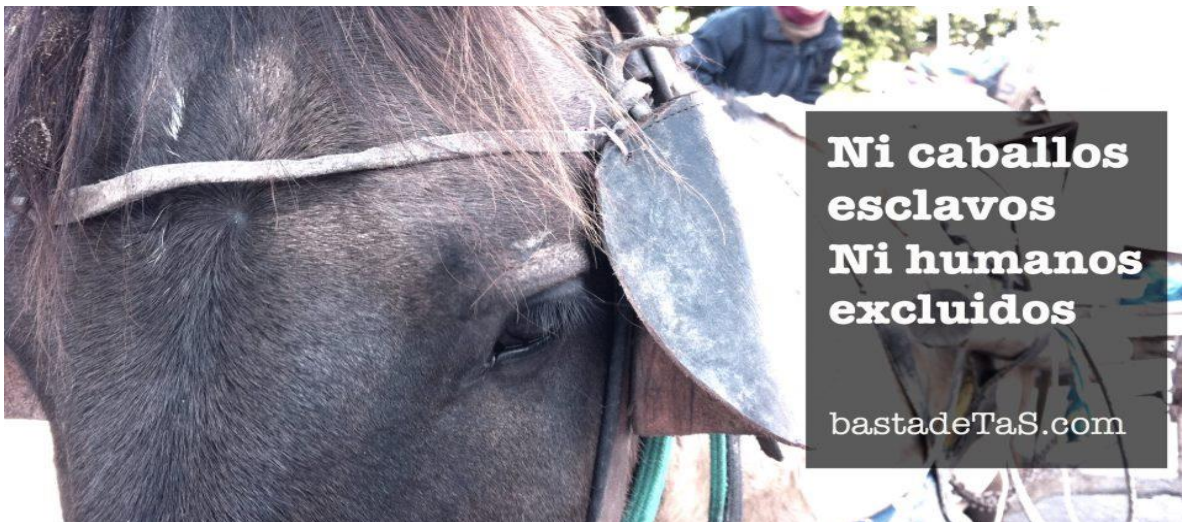
Recuperada de Facebook - Campaña Basta de TaS (Basta de Tracción a Sangre). 07-11-2012.

Se trata de diferentes acciones que buscan la empatía entre los animales humanos, los animales no humanos y la naturaleza mediante recursos estéticos que logren movilizar a partir de una