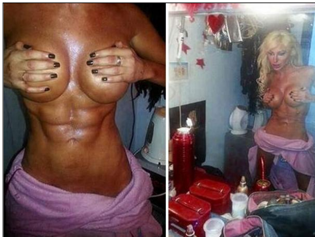
Foto 02 “Victoria Xipolitakis exhibiendo sus abdominales comprados” 13