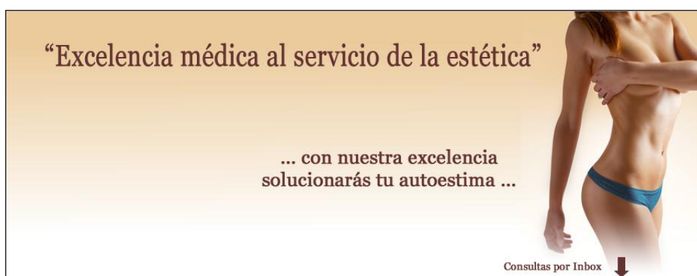
CUADRO 3: Publicidad de productos dietéticos. 11