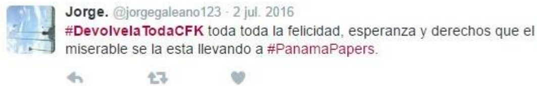
Gráfico 13, Twitter, 2 de julio de 2016

En los casos de los internautas que pertenecen al grupo de los pro-destinatarios, seguidores, se observan los motivos temáticos del apoyo y la felicidad por la vuelta de Cristina Kirchner, los insultos y agravios a los “gorilas”, y la mención a las cuentas en el exterior del presidente Macri a través del hashtag #PanamaPapers. Se da la utilización también del trending topic #DevuelveLaTodaCFK, en este caso con el fin de producir emociones positivas sobre la vuelta de Cristina. Y se agrega al tema de Cristina Kirchner como una defensora de los argentinos. La argumentación aquí también se da por la vía pasional y observamos que se utilizan los hashtags