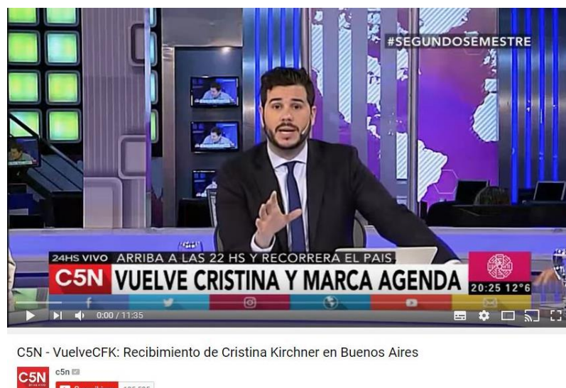
Gráfico 06, Youtube, 2 de julio de 2016

transformen en internautas y se sumen a la utilización de ese hashtag. En este caso, los trending topics que el medio propone tienen que ver con la coyuntura política del país, el hashtag #SEGUNDOSEMESTRE, se refiere al discurso macrista de campaña que sostenía que las mejoras de la gestión se reflejarían en la segunda mitad del 2016.