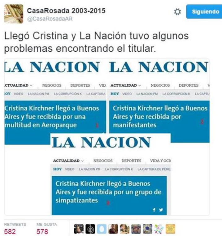
Gráfico 17, Twitter. 2 de julio de 2016

Finalmente, en esta etapa, las agrupaciones y las cuentas afines al kirchnerismo retoman también contenido publicado en medios masivos y lo replican en las redes sociales. En la captura seleccionada, es relevante observar cómo la cuenta @CasaRosadaAR, selecciona varios titulares de La Nación que hacen alusión a la misma nota, pero que se diferencian en el modo de denominar a los asistentes a la concentración en Aeroparque. Hecho que prueba que los motivos temáticos son diferentes entre los medios y los enunciadores comunes (ver Gráfico 17).