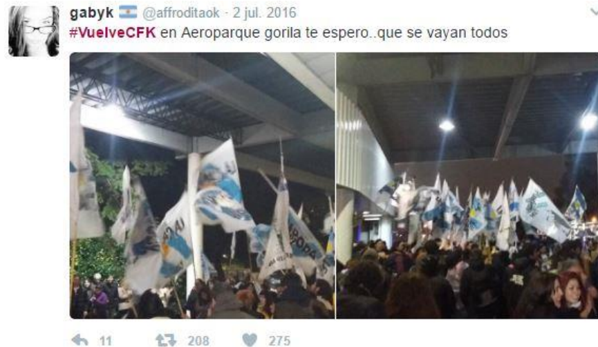
Gráfico 12, Twitter, 2 de julio de 2016