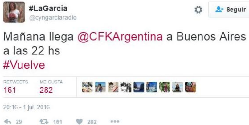
Gráfico 05, Twitter, 1 de julio de 2016