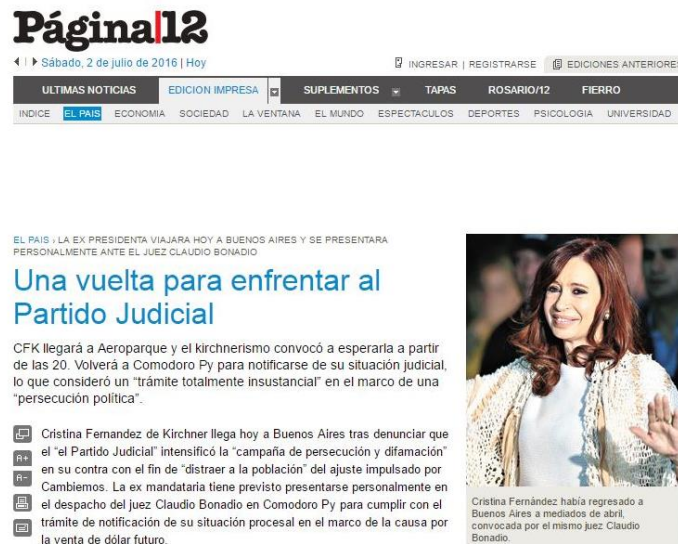
Gráfico 03, Página 12. 2 de julio de 2016