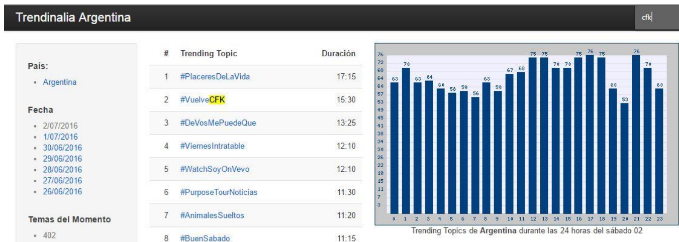
Gráfico 09, Trendinalia.com, 2 de julio de 2016