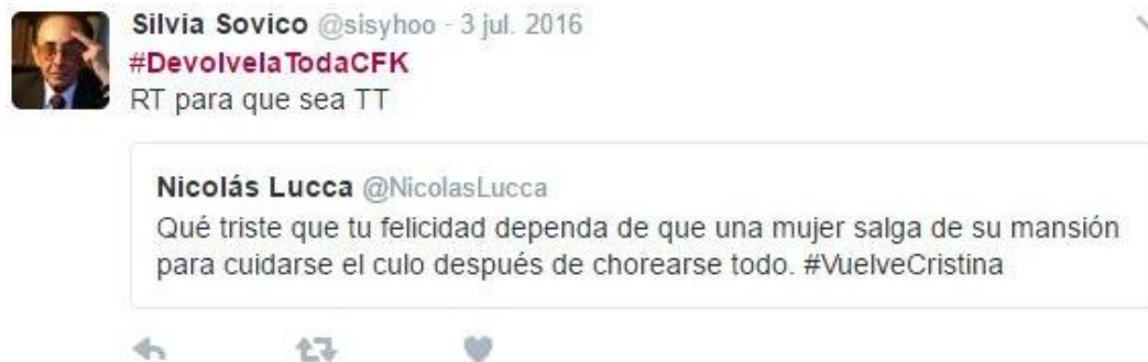
Gráfico 11, Twitter, 3 de julio de 2016