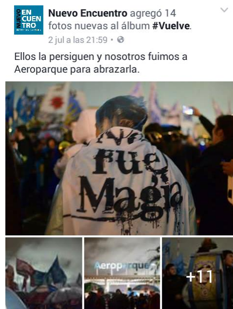
Gráfico 16. Facebook, 2 de julio de 2016

En la última fase analizada se encontró que durante el 3 de julio, las publicaciones relevadas de los internautas en redes sociales y de los políticos que convocaron al recibimiento son mayormente fotos y videos propios de la concentración. Se visualiza en las publicaciones de La Cámpora y de Nuevo Encuentro, la utilización del hashtag #Vuelve, y se hace referencia a al motivo temático de una persecución política dirigida hacia Cristina Kirchner –“Ellos la persiguen y nosotros fuimos a Aeroparque a abrazarla”-, al igual que en las notas periodísticas de Página 12 (ver Gráfico 16). El sentido otorgado por las agrupaciones en estas publicaciones, expresa un recibimiento cálido hacia Cristina Fernández de Kirchner, y se la nombra como una compañera más, en detrimento de lo expresado por los medios masivos.