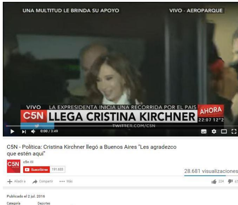
Gráfico 07, Youtube. 2 de julio de 2016