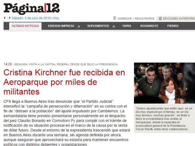
Gráfico 15, Página 12. 2 de julio de 2016