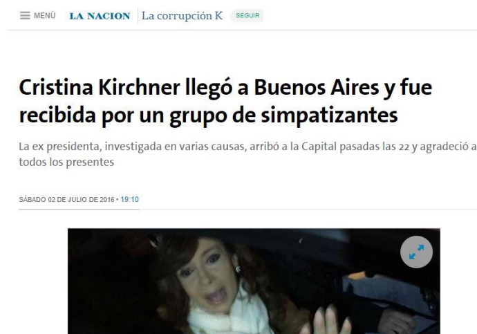
Gráfico 14, La Nación, 2 de julio de 2016

Retoma la voz de Cristina "quiero agradecerles que estén acá un día tan especial por el tiempo. Es un día muy lluvioso, pueden estar en sus casas y les agradezco que estén aquí". Y agrega el motivo temático- al igual que Clarín- referido a que la organización de este evento se realizó en el marco de las investigaciones en las causas contra la ex mandataria. Por otra parte, el medio sostiene que la cantidad de simpatizantes fue menos que en abril, y finalmente agrega que en Recoleta, frente a su departamento, también la esperaban sus seguidores.