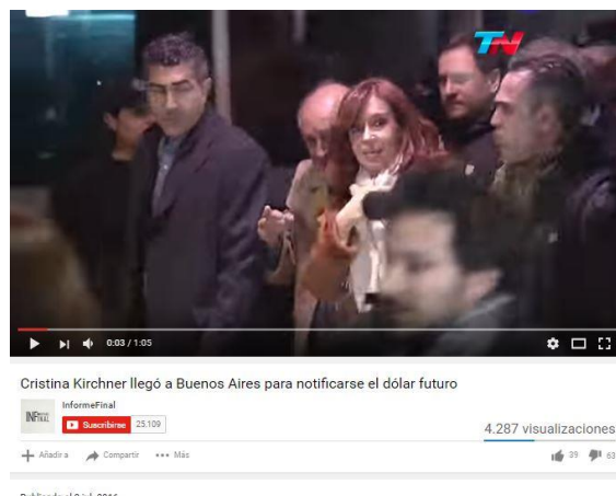
Gráfico 08, Youtube. 2 de julio de 2016

En la transmisión en directo de C5N se observa que el medio retoma el motivo temático propuesto por Ámbito Financiero respecto de la recorrida por el país, y además un videograph con el título “una multitud le brinda su apoyo”, hecho que también permite analizar el motivo temático de la presencia de los militantes seguidores, que se observó en las publicaciones de Página 12 y de las agrupaciones políticas que convocan a su recibimiento (ver Gráfico 07).