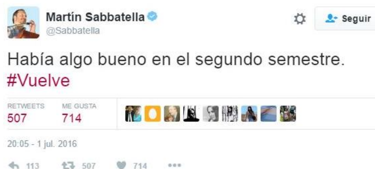
Gráfico 04, Twitter, 1 de julio de 2016